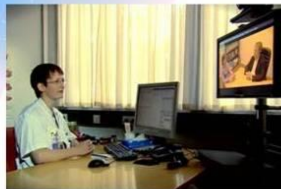
Specialist kijkt mee en geeft ondersteuning op afstand, via videocontact of foto/film van situatie thuis