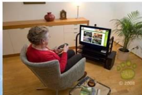
Thuis heeft men toegang tot zorg, welzijn en videocontact met familie en lotgenoten