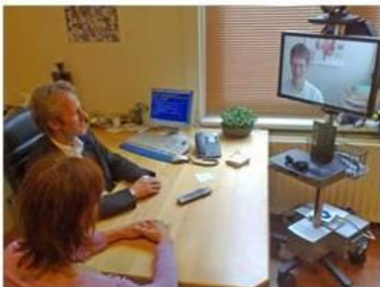
Videoconsultatie medisch specialist, samen met de huisarts in de praktijk