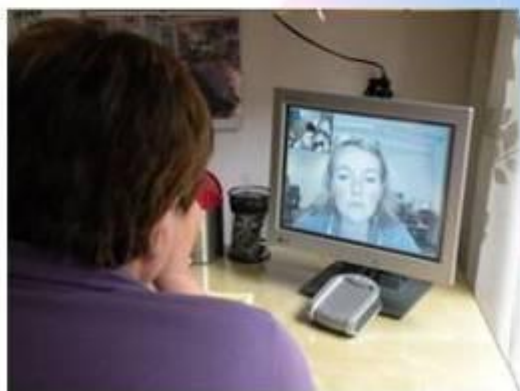
De zorgcentrale is 24x7 bereikbaar voor begeleiding op afstand of spoedzorg thuis